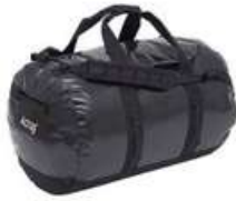
Mochila ou Trolley. Máx. 20kg