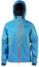
Casaco Impermeável - Gore Tex