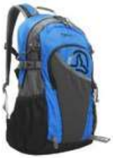
Mochila de dia a dia