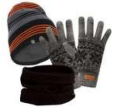
Gorros, luvas e Golas

Nota: Todo o material listado em "material necessário" foi cuidadosamente seleccionado de acordo com as condições meteorológicas e as actividades no destino. Por razões de segurança, no caso de não possuir o "material necessário", os nossos guias podem optar por limitar a participação na actividade planeada.