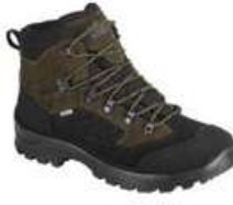
Botas ou ténis de trekking