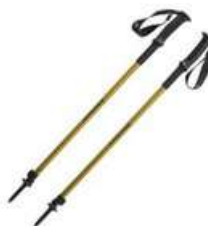
Bastões de trekking*