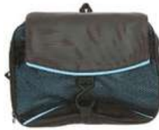
Artigos Higiene Pessoal