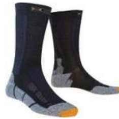
meias de trekking